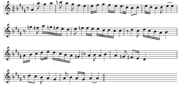
Zîrgüleli hicaz makamı seyir örneği

Zîrî b. Atıyye'nin Mağrib'deki bu başarısı Endülüs Emevî Devleti'nde büyük bir memnuniyetle karşılandı. 378'de (988) Zenâte'nin seçkin emirlerinden kardeşi Mukâtil b. Zîrî'nin ölümünden sonra Zenâteliler'in lideri olan Zîrî b. Atıyye ertesi yıl Endülüs Emevî Hükümdarı II. Hişâm'ın hâcibi İbn Ebû Âmir el-Mansûr'un davetlisi olarak Kurtuba'ya (Cordoba) gitti. İbn Ebû Âmir, kendisine görkemli bir törenle karşıladı ve ona vezir unvanını tevcih et-