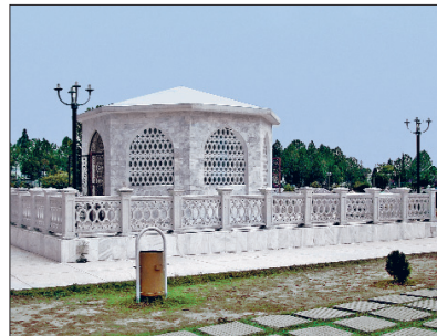
Ziyâülhak'ın İslâmâbâd'daki türbesi ve mezar taşı