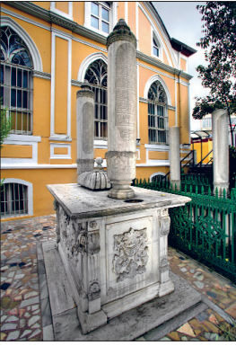
Zühdü Paşa'nın bânisi olduğu caminin haziresindeki kabri – Kızıltoprak / İstanbul

mak, teşkilâtını ve programını düşünmek ve düzenlemekle işe başladı. Çeşitli Avrupa ülkeleri üniversitelerinden iç tüzük ve programlar getirilip Türkçe'ye çevrildi. Kurulan komisyon toplantılarına Zühdü Paşa bizzat başkanlık ederek dârülfünunun açılması yolunda büyük çaba harcadı. 19 Ağustos 1900'de Mekteb-i Mülkiye'de yaptığı bir konuşma ile dârülfünunu öğretime açtı. Malî müzakereler yapmaksızın, Düyûn-ı Umûmiyye'nin ertelenmesi ve yeni istikrazlar için ilki 1875'te iki defa Paris'e, bir defa da Londra'ya gitti. Rus savaşı esnasında bazı malî tedbirler alınması ve istikraz gayesiyle tekrar Londra'ya gidip başarı ile geri döndüğü resmî hal tercümesinde yazılıdır. Maarif nâzırı iken 12 Nisan 1902'de Koska'daki konağında vefat eden Ahmed Zühdü Paşa vasiyeti gereğince, 1301 (1884) yılında Kadıköy Kızıltoprak'ta inşa ettirdiği caminin (Zühdü Paşa Camii) haziresindeki kabristana defnedildi. Kurduğu bir vakıfla öğrencileri ücretsiz kabul eden bir ilkokul yaptırdı. 1888-1921 yılları arasında açık kalan bu okulun öğretmenleriyle çalışanlarının maaşlarının ödenmesi ve caminin masraflarının karşılanması için birtakım emlak ve arazilerini tahsis etmişti. Çeşitli madalya ve nişanlar alan Zühdü Paşa'nın şairliği de vardır. Ayrıca idâdilerde uzun yıllar okutulan ve günümüzde de bastırılan el-Mecmûatü'z-Zühdiyye fi'l-ahkâmi'd-diniyye adlı (I-II, İstanbul 1311, 1313), fıkıh meselelerini ihtiva eden bir kitap yazmıştır.