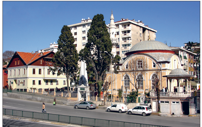
Zühdü Paşa Camii ve Mektebi – Kızıltoprak / İstanbul

Zühdü Paşa Camii, yapıldığı dönemin mimari özelliklerine uygun biçimde çeşitli unsurların bir arada uygulandığı karma (eklektik) üslûpta inşa edilmiştir. Caddeseyesinden yüksekte kalan bir platformun üstünde etrafı madenî parmaklıklarla çevrili bir avlunun içinde yer alır. Avlunun caddeye bakan ana kapısı üzerindeki manzum kitâbe ta'lik hattıyla sekiz kartuş içine yazılmıştır. Kitâbe gülbezeklerle süslü mermer bir alınlıkla taçlandırılmıştır. Caminin cümle kapısı üzerinde âyet kitâbesi bulunur. Son cemaat yeri ahşap tavanı olan, dikdörtgen planlı kapalı bir mekân halindedir. Üst katındaki kadınlar mahfiline sol (güneybatı) kenarından ahşap bir merdivenle çıkılır. Bu merdivenin altında minare kapısı vardır. Tek bir kapının açıldığı kare planlı harim kısmının üzerine kalın duvarlar ve dört geniş kemer üstüne oturan, geçişleri pandantiflerle sağlanmış bir kubbe örtmektedir. Çokgen kesitli siğ bir niş halindeki mihrabı kible duvarı içine gömülmüş olup dışarıya taşkınlık göstermez. İç yüzeyi önceleri kalem işleriyle bezeliyken günümüzde Kütahya çinileriyle kaplı durumdadır. Mihrabın iki yanında zarif pilastırlar bulunur. Minberle vaaz kürsüsü ahşap olup üzerleri yağlı boya ile boyanmıştır. Özellikle külâh kısmında eklektik üslûbun kuvvetle hissedildiği minberin merdiven korkuluk şebekeleri ajurludur. Köşk kısmının kaş kemerli çatısı üzerinde yer alan piramit şekilli külâhın kenarlarındaki üçgen alınlıklar söz konusu yabancı