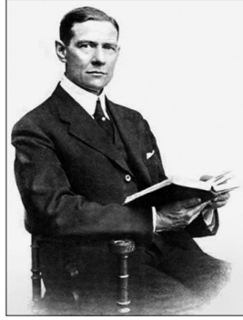
Samuel M. Zwemer

12 Nisan 1867'de Vriesland'da (Michigan) Hollanda'dan Amerika'ya göç eden bir ailenin on beş çocuğundan on üçüncüsü olarak doğdu. Babasının papazlık yaptığı, Protestanlığın bir koluna ait Vriesland kilisesi, başta Amerika Birleşik Devletleri ve Kanada'da olmak üzere misyonerlik faaliyetlerinde bulunmak için Güney Afrika, Seylan ve Sri Lanka'da çeşitli şubeler açtı. Zwemer'in altı kız kardeşi öğretmen, biri Arabistan'da misyonerlik yaparken ölen dört erkek kardeşi de din adamı idi. Zwemer, devlet okulunda ilk ve orta öğrenimini yaptıktan sonra 1887'de Hollanda'da Reformed kilisesine bağlı Hope College'da lisans eğitimini tamamladı ve yine aynı dinî geleneğe bağlı bir yüksek öğrenim kurumu olan New Jersey Brunswick İlahiyat Fakültesi'nde (Theological Seminary) din eğitimi aldı. Amerikan misyonerliğinin etkin ve yaygın hale geldiği bir