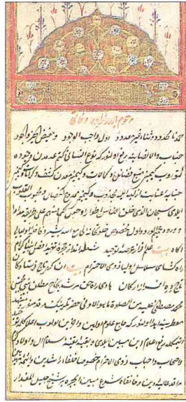
Baldırzâde Mehmed Efendi'nin Ravza-i Evliyâ adlı eserinin ilk sayfası (İÜ Ktp., TY, nr. 2556)

Eserleri. 1. Ravza-i Evliyâ . Bursa'da yaşayan âlim, şeyh ve şairlerin hayat hikâyelerini ihtiva eden bu eser, Türk edebiyatı tarihinde kendi türünün ilk ve en iyi örneklerindedir. Eserde Emîr Sultan'dan (ö. 833/1429-30) müellifin zamanına kadar yaşamış 200'den fazla şahsın biyografisi bulunmaktadır. 1059 (1649) yılında tamamlanan eserin adı Şeyhülislâm Karaçelebizâde Abdülaziz Efendi tarafından konulmuş ve bu isim ebced hesabıyla kitabın yazılış tarihine uygun düşmüştür. Eserinin sonunda müellif babasından ve kendisinden de söz etmektedir. İstanbul Kütüphaneleri Tarih Coğrafya Yazmaları Katalogu 'nda sekiz nüshası gösterilmiş olan Ravza-i Evliyâ 'nın İstanbul Üniversitesi Kütüphanesi (TY, nr. 2556) ile Bursa Eski Yazma ve Basma Eserler Kütüphanesi'nde (Orhan Kitapları, nr. 1018/1) ve daha birçok yerde yazma nüshaları vardır. Vefeyât-ı Baldırzâde adıyla da anılan eserin zeyillerinden ilki ve en önemli olanı, Bursalı İsmail Belîğ'in yazdığı Güldeste-i Riyâz-ı İrfân ve Vefeyât-ı Dânişverân-ı Nâdiredân 'dır. 2. Hâşiye 'alâ Şerhi's-Seyyid 'ale'l-Miftâh . Ebû Ya'kûb Sekkâkî'nin kaleme aldığı Arap diline ait Miftâhu'l-'ulûm adlı eserin belâgat kısmına Seyyid Şerif Cürçânî'nin yazdığı