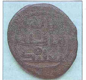
Ba'lebek'te basılmış tarihi belirsiz bakır sikke (İstanbul Arkeoloji Müzesi, Teşhir, nr. 140)