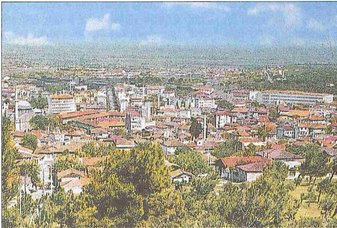
Balıkesir'den bir görünüş

Sınırlı arkeolojik araştırmalardan, bölgenin tarih öncesi devirlerden beri meskûn olduğu anlaşılmaktadır. Balıkesir'in kuruluş tarihi ise kesin olarak bilinmemektedir. Ancak ilk iskân yerinin şehrin 26 km. doğusunda Kepsut civarındaki Akhyauros (Hadrianoutherai) olduğu tahmin edilmektedir. Bu şehir İstanbul-Miletopolis güzergâhında önemli bir ticarî merkez olmuştur. Strabon'a göre bölgenin en eski sakinleri Bitinler, Mizler ve Frigler'dir. Strabon bunların Traklar olabileceğini de ifade etmektedir. Bugünkü şehrin bulunduğu yerde iskânın çok