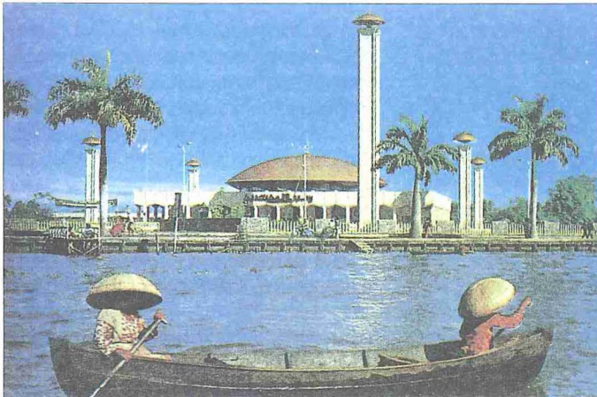
Bancermasin Ulucamii - Borneo / Endonezya

Başlıcaları Neira, Lonthor, Run, Ay ve Rosengain adını taşıyan bu küçük adalar, baharat yetişen yerler arasında büyük şöret bulmuş ve milletlerarası ticarete çok tanınmışlardı. Banda adalarının ünü sadece Cavalı, Malaylı ve Çinli tüccarlar arasında ve Asya'da değil aynı zamanda Arap ve Venedikli tüccarlar vasıtasıyla Ortadoğu ve Avrupa'da da ya-