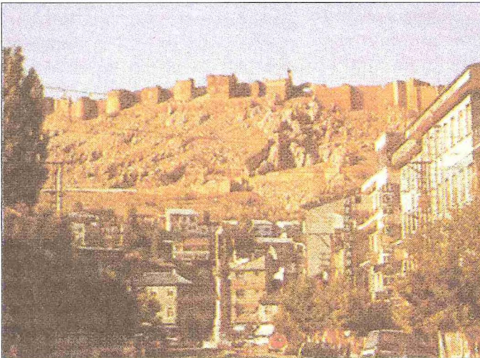
Bayburt Kalesi'nin şehirden görünüşü

Müdafaa hendeği bulunmadığından iki kat sur ile çevrili olan kale beş veya altı cepheli olup çevresi 2 kilometreden uzun ve yüksekliği 30 m. kadar olan surlarla kuşatılmıştır. İç ve dış surlar arasındaki mesafe 200 metredir. İstinat duvarları ile takviye edilmiş bu surların köşeleriyle muhtelif yerlerinde yarım daire, dörtgen, üçgen şeklinde burçlar yer almaktadır. Dış surlar, kaleye heybetli bir manzara veren yalçın kayalar üzerine yapılmıştır. 1647'de Bayburt'u ziyaret eden Evliya Çelebi kale içinde 300 evlik bir mahalle ile Ebû'l-Feth Camii'nin bulunduğunu yazmaktadır. Yine onun bildirdiğine göre kalenin doğu ve batıda iki büyük kapısı bulunmaktadır. Üç kat demirden yapılmış doğudakine Demirkapı, diğerine ise Nöbethâne Kapısı denilmektedir. Asırlar boyunca Trabzon-İran transit yolu üzerindeki önemli bir konaklama yeri olan Bayburt'la bu yolun