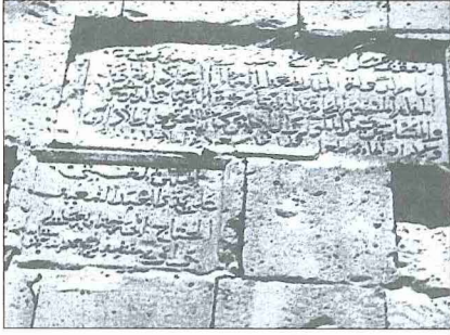
Bayburt Kalesi'nin Nöbethâne Kapısı'ndaki tamir kitâbesi

muhafazası için önemli bir müstahkem mevki olan kalede 1520 yılına ait bir kayıttta 397 muhafız ve külliyyetli miktarda top, tüfek ve savaş malzemesi bulunduğu belirtilmektedir. Zaman zaman işgal ve tahribata uğrayan kale ve buradaki mahalle son olarak 1828 Osmanlı-Rus savaşı sırasında Ruslar tarafından büyük çapta tahrip edildikten sonra 1980'li yıllara kadar kendi haline terk edilmiştir. Bu tarihten sonra tamamen yıkılma tehlikesiyle karşı karşıya kalan bazı kısımları tamir edilmiş de mahallesi ve camii ihya edilmemiştir. Kitâbelerden anlaşıldığına göre kale Tuğrul Şah'ın saray hizmetkârlarından "sipehsâlâr", "üştâdüddâr" lakaplı mimar Ziyâeddin Lü'lü eliyle tamir edilerek bazı burçlar inşasıyla da takviye edilmiştir. Surların şehre bakan yüzünde Tuğrul Şah'ın karısı Hatice Sultan'ın inşa ettirdiği burcun nehihile yazılmış tek satırlık kitâbesi 1936 yılına kadar mevcutken günümüzde kaybolmuştur.