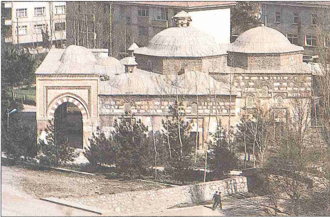
Bayezid Paşa Camii - Amasya

İslâm hukukunda baygınlık anlamında kullanılan İğmâ kelimesinin kökünde "örtmek, perdelemek" mânası vardır. Baygınlık da bir bakıma akli örten