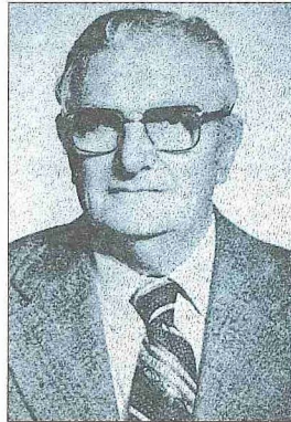
Bekir Sıtkı Baykal

Bekir Sıtkı Baykal Türk Ansiklopedisi 'nde de çeşitli görevler yaptı. Burada çok sayıda madde kaleme aldığı gibi maddelerin çoğu da kontrolünden geçti. İslâm Ansiklopedisi için de "Mustafa III" ve "Râgıb Paşa" maddelerini yazdı. Uzun yıllar üniversitede Avrupa tarihi derslerini okuttu. Yılların birikimini Yeni Zamanlarda Avrupa Tarihi (Ankara 1961) adlı kitabında topladı. Üyesi bulunduğu Türk Tarih Kurumu'nun Belleten adlı dergisinde sahasıyla ilgili çeşitli makaleleri yayımlandı. Ayrıca Dil ve Tarih-Coğrafya Fakültesi'nin aynı adla çıkan dergisinde ve Tarih Araştırmala-