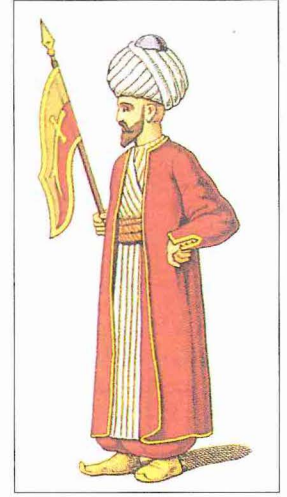
Bayraktar (M. Şevket Paşa, Osmanlı Teşkilât ve Kıyâfet-i Askeriyesi, İÜ Ktp., TY, nr. 9391)

"Bayrak tutan, taşıyan" anlamına gelen bayraktar (bayrakdar), Türkçe bayrak kelimesiyle Farsça dârdan (sahip olan) oluşmuştur; çok defa alemдар * ve ba-