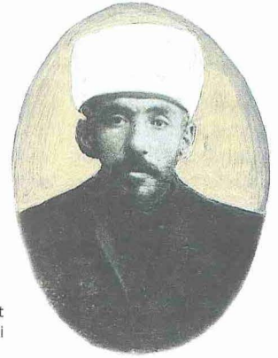
Ali Himmet Berki

Demircizâde kadı Osman Efendi'nin oğlu olup 17 Ocak 1882'de babasının kadılık yaptığı Elbistan'da doğdu. Resmî belgelerde doğum tarihi hicrî 1301 (1884) olarak belirtilmekteyse de Berkî kendi doğum tarihi olarak hicrî 1299 yılını vermektedir ( Mecelle , mukaddime, s. XV). Aslen Akseki'nin Unulla köyündendir. İlk öğrenimini köyünde ve İbradi Rüşdiyesi'nde yaptı. Daha sonra İstanbul'a gitti ve Tokatlı Mehmed Şâkir Hoca'dan ders okuyarak icâzet aldı (1909). Ayrıca Medresetü'l-kudât'ı 26 Ağustos 1909'da birincilikle bitirdi. İlk olarak Meşihat-ı İslâmîyye Dairesi Fetvahânesi'nde İ'lâmat Odası kâtipliğine (1909), kısa bir süre sonra yine İ'lâmat Odası memur yardımcılığına, 18 Eylül 1911'de de müsevvidliğe tayin edildi. Ali Himmet 1913'te ilâve bir