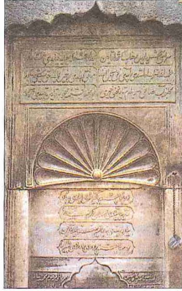
Moralı Beşir Ağa'nın Mercan'daki 1140 (1727-28) tarihli çeşmesi ve kitâbesinin kendisinin yazdığı 1157 (1744) tarihli çeşmesi - Sultanahmet / İstanbul