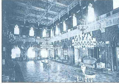
Beykoz Kasrı'nın tavan süslemelerinden bir örnek ve kasrın alt kat salonunun XIX. yüzyıl sonunda çekilmiş bir fotoğrafı

edilmek üzere yaptırmak istediği Beykoz Kasrı'nın temelini attı. Kasrın yapımı on bir yıl sürdü ve Kavalalı Mehmed Ali Paşa'nın oğlu Said Paşa tarafından tamamlanarak 1855'te Abdülmecid'in yerine geçen kardeşi Abdülaziz'e armağan edildi. Ziver Efendi'nin (Paşa) düşürdüğü manzum tarih bir kitâbeye işlenerek kasrın bulunduğu koru-parkın deniz tarafındaki kapısına konuldu. İstanbul'da inşa edilen bir ilk kâgir kasrın plan ve projelerinin Nikogos Balyan'a, müteahhitliğinin de Sarkis Balyan'a yapıldığı ileri sürülmekteyse de bu bilgilerin kesin belgelere dayanmadığı görülmektedir.