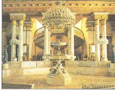
Beylerbeyi Sarayı'nda Mavi Salon'un eski bir fotoğrafı (İÜ Ktp., Albüm, nr. 90.872) ve resmî törenler için kullanılan Havuzlu Salon

Yapının arka tarafında bulunan set bahçeleri Harem ve Mâbeyn bölümlerini birbirinden ayırmaktadır. Birbirlerine merdiven ve rampalarla bağlı bu set bahçelerinin en üstünde Sarı Köşk ve Mermer Köşk adlarında iki yapı bulunmaktadır. Sarı Köşk adını renginden, Mermer Köşk ise sofasındaki mermer havuzla duvarlarındaki selsebillerden almıştır. Bu köşkerin önünde 80 × 30 m. boyutlarında bir havuz bulunmaktadır. Havuzun günümüzde Boğaziçi Köprüsü ayağına bakan tarafında ise saray atlarının bakımı için yaptırılmış, tavanında renkli armalar ve hayvan tasvirleri bulunan ve türünün en zengin örneği olan Ahır Köşkü yer almaktadır.