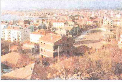
Beyşehir'den bir görünüşü

ve onun oğlu Mehmed Bey burada sancak beyi olarak bulundular. Beyşehir'in Seydişehir ve Bozkır bölgesini kapsayan sancağın merkezi olması II. Bayezid devrinde gerçekleşti. XVI. yüzyılda ise Karaman eyaletinin yedi sancak ve kaza merkezinden (Konya, Akşehir, Niğde, Aksaray, Kayseri ve Kırşehir) biriydi. 210.000 akçe has* a sahip olan Beyşehir sancak beyi burada otururdu. Beyşehir'in merkezi olduğu sancak idarî ve adlî bakımdan iki kaza ile dokuz nahiyeden oluşuyordu. Bunlar Beyşehir ve Seydişehir kazaları ile Göçü, Kireli, Cezîre (Cezâir), Yenîşehir (Yenişar), Kaşaklı, Yağan, Yaylasun, Gurgurum ve Bozkır nahiyeleriydi. Gurgurum ve Bozkır nahiyeleri Seydişehir kazası sınırları içindeydi. Ayrıca XVI. yüzyılda Beyşehir Karaman eyaletinin en kalabalık bölgesi ve Konya'dan sonra en zengin sancağı idi. Kâtib Çelebi XVII. yüzyıl ortalarında burayı kaza ve kasaba olarak zikreder. Tanzimat'ın ilânından bir süre önce ise burası müsellemlik* merkezinde durumundaydı.