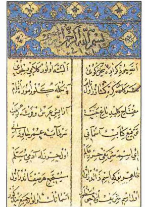
Bihiştî'nin Leylâ vü Mecnûn adlı mesnevisinin ilk sayfası. (İÜ Ktp., TY, nr. 5591)

Bihiştî bundan sonra eski mevkii elde etti ve padişahın yanında bulunarak onun çeşitli iltifatlarına mazhar oldu. Nitekim adı geçen in'âmât defterinde Bihiştî'ye 909 yılında (1503) padişah tarafından in'amda bulunulduğu bildirilmektedir. Bihiştî bir ara sancak beyliği yaptı. Ancak hayatının bu devresiyile ilgili herhangi bir bilgi bulunmamaktadır. Bihiştî'nin, tarihi kesin olarak bilinmemekle beraber XVI. yüzyılın başlarında vefat ettiğinde kaynakların hemen hepsi birleşmektedir. Ménage onun tarihini