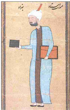
Bihzâd'ı yaşlılık yıllarında gösteren bir minyatür (İÜ Ktp., FY, nr. 1422, vr. 34 a )

Sanatçının en faal döneminin Herat'ta Hüseyin Baykara (1468-1506) zamanında olduğu anlaşılmaktadır. Tebriz sarayına geldikten sonra yaşlılığı sebebiyle sanat faaliyetinde bulunduğunu söylemek zordur. Nitekim Şah İsmâil ve Şah Tahmasb dönemine ait Bihzâd'a atfedilebilecek bir minyatür bulmak güçtür. İstanbul Üniversitesi Kütüphanesi'ndeki bir albümde (FY, nr. 1422, vr. 34 a ) Bihzâd'ı yaşlılık yıllarında gösteren bir minyatür portresi yer almaktadır. 1520-1530 yılları arasında yapıldığı sanılan bu resimde Bihzâd oldukça zayıf, esmer tenli ve bir hayli yaşlı olarak gösterilmiştir. Sanatçının bu dönemdeki faaliyeti yöneticilik ve Safevî sarayındaki nakkaşların eğitimi üzerine olmalıdır. Haydar Mirza, Bihzâd'ın öğrencileri arasında portre sanatçısı olduğunu belirttiği Kâsım Ali Maksûd ile Molla Yûsuf'u zikreder. Mustafa Âlî ise Horasanlı Şeyhzâde ile Âgâ Mîrek'i, İskender Münşî de Muzaffer Ali'yi yetiştirdiğinden söz ederler. Topkapı Sarayı Müzesi'ndeki bir albümde (H, nr. 2161, vr. 52 b ) yer alan genç bir Safevî soylusunun tasvirinin altındaki yazı, Bihzâd'ın yetiştirdiği öğrencilerden birinin