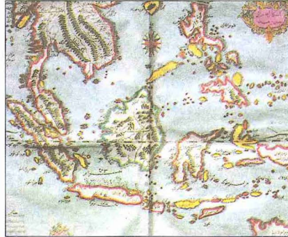
XIX. yüzyıl sonlarında adadan bir görünüşü ve Kâtib Celebî'nin Cihannüma adlı eserinde Borneo adasını gösteren harita (İstanbul 1145, s. 131)

vardır. Bu nehirler güney ve güneybatı kesimlerinde bazı geniş bataklıklar meydana getirirler. Adanın dörtte bire yakın kısmı ovadır. Geri kalan kesimi genellikle yüksek ve engebeli olup üzerinde birçok dağ sıraları ve Sabah sınırları içindeki Kinabalu dağı (4102 m.) gibi ayrı ayrı dağlar yer alır; aralarında aktif volkan yoktur. Borneo'da çoğu sık ağaçlı ormanlarda olmak üzere orangutan, babun, çift boynuzlu gergedan, timsah, yaban öküzü, geyik ve pek çok küçük hayvanla çeşitli kuşlar yaşar. Toprak verimsizdir; başlıca ürünler arasında kereste, kara biber, kâfur, sagu, pirinç, hint kamışı ve kauçuk bulunur.