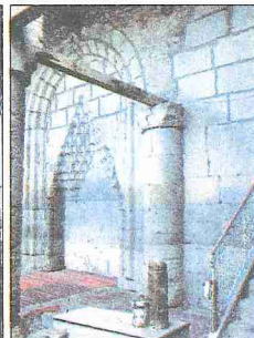
Bulgur Tekkesi Mescidi ve mescidin taş mihrabı ile duvar pâyesi - Konya