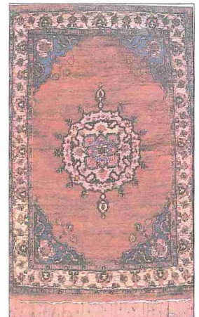
Cammü'da elde dokunmuş yün halı (D. N. Saraf, Arts and Crafts Jammu and Kashmir, New Delhi 1987, s. 98)

Önceleri Tavî nehrinin her iki kıyısında uzanan Cammü idarî bölgesi XVI. yüzyılda nehrin bir tarafı Cammü, diğer tarafı Bahu idarî bölgeleri olmak üzere ikiye ayrılmış, XVII. yüzyılda Bâbürlüler idaresine geçince tekrar birleşmiştir. Bugün yüzölçümü 3165 km 2 olan Cammü idarî bölgesi başta Cammü olmak üzere Samba, Aknur, Kathua, Riasi, Rajaori, Udhampur, Bhadarva, Kisthwar şehirleriyle bunların yanında birçok küçük kasabayı içine alır. Genel nüfus 943.395'tir (1981). Bölgede Dogra Râcpûtları, Guccerler ve Catlar gibi mahallî topluluklar yaşamaktadır. Bunların büyük bir kısmı göçebedirler ve el dokumacılığı, dericilik, hayvancılık ve tarımla uğraşırlar. Koyun, keçi, yak ve midilli besler, mısır, arpa, buğday ve pirinç yetiştirirler. Ortalama sıcaklık ocak ayında 14° C, temmuz ayında 33° C'dir. Halkın çoğu Dogrî Pencabî dilini konuşur. Müslümanlar Cammü, Udhampur ve Kathua şehirlerinde yoğun olmakla birlikte idarî bölge nüfusunun ancak % 34'ünü oluştururlar; halkın geri kalanı Hindü ve Sih'tir. Bugün bağımsızlık için mücadele eden Cammü - Keşmir eyaletinin genelinde müslümanlar çoğunluktadır; 1981'de 5.987.389 olan nüfusun 3.843.451'i müslümandır.