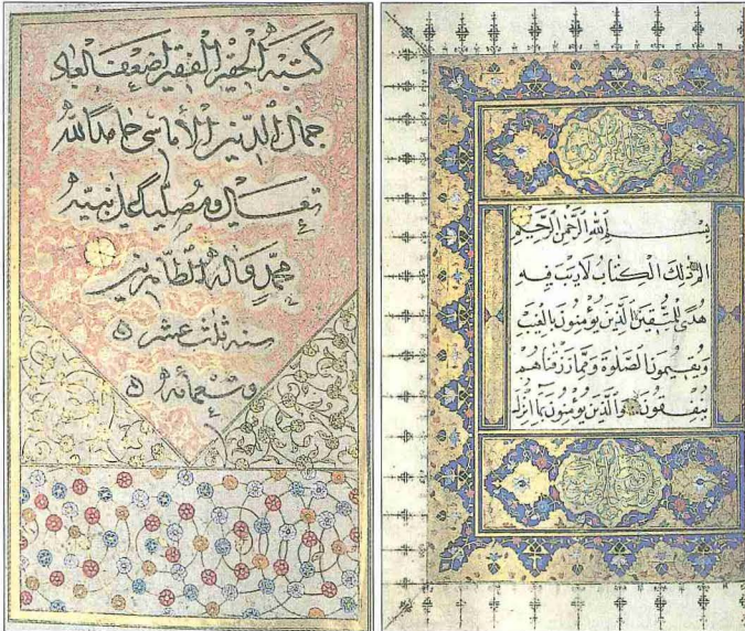
Cemal Amâsî'nin nesh hattı ile yazdığı Mushaf-ı Şerif'ten Bakara sûresinin ilk âyetleri ve mushafın hatt-ı icâze ile ketebe sayfası (TIEM Ktp., nr. 97)

Tabii bir ses güzelliğine sahip olan, zamanın önde gelen mevlidhan ve na'thanlarından Hâfız Cemal Efendi, asıl şöhretini tiz perdelerden okuduğu ezanlarla yapmıştır. Arkadaşlarından tarihçi ve müzikşinas Ali Rıza Sağman, Meşhur Hâfız Sâmî Merhum adlı eserinde ondan bahsederken, "Yalnız ezan okumak için yaratılmış, ezanda bir Bilâl-i Sâni idi. Mevlid nasıl ki Sâmî'de (Hâfız Sâmî) en ulvî sesini kaybetmiş ise ezan okumak da Hâfız Cemal ile gitmiştir. Cemal ezan okumaya başlayınca bütün muhit vecd içinde titrerdi. Ezan bitinceye kadar evler, yollar, meydan mutlak bir sükût içinde kalırdı" demektedir. Süleymaniye Camii müezzinleriyle karşılıklı olarak okuduğu sabah ezanları da meşhurdur. Millî Mücadele'yi takiben "Şehitlikleri İmar Cemiyeti" tarafından Anafartalar'da Çanakkale şehidleri için mevlid okumak üzere davet edilen heyette yer alan Hâfız Cemal'in Gelibolu önlerinde vapurdan okuduğu sabah ezanı, hâfizalarda derin iz bırakan bir okuyuş olarak kaynaklara geçmiştir. Yurt içinden ve yurt dışından gelip onun ezan ve salâsını dinlemek için minare dibinde bekleyenlerin bulunduğu da şifâhî rivayetler arasındadır. Cemal Efendi'nin ezan