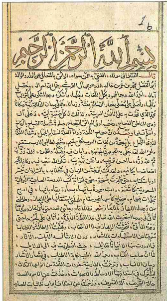
Cemâl-i Karşî'nin eş-Şurâh mine's-Şihâh adlı eserinin II. Bayezid'in mütalaaesi için hazırlanan nüshasının ilk iki sayfası (Süleymaniye Ktp., Damad İbrahim Paşa, nr. 1124)