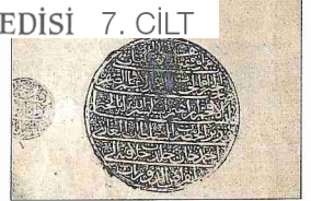
Cemâl-i Karşî'nin eş-Şurâh mine's-Şihâh adlı eserinin unvan sayfası