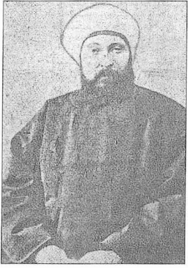
Hâlidefendizâde Cemâleddin Efendi

nularında ve bütçe müzakerelerinde çok sert muhalefette bulunmuş, Sultan Abdülhamid de şeyhülislâmın rızası olmadan kararları onaylamayacağını sadrazama bildirmişti. Cemâleddin Efendi başka konularda da kararlı davranmaktan çekinmemiştir. 1912 yılında Balkan Savaşı'nın bütün şiddetiyle devam ettiği ve askerlerin koleradan kırıldığı bir sırada, bunların bakımı için elverişli yerler bulunamaması üzerine, Cemâleddin Efendi'nin damadı olan Şehremini Cemil Paşa bazı camilerin bu iş için ayrılmasını teklif etmiş, Evkaf Nâzırı Ziyâ Paşa da bu teklife şiddetle karşı çıkmıştı. Ancak şeyhülislâm gerekirse bütün camilerin yaralı ve hasta askerlere tahsisi için fetva verebileceğini söylemiş, böylece birkaç cami koleralı askerlere ayrılmıştı. Cemâleddin Efendi başta cuma selâmlıkları olmak üzere bütün merasimlerde en başta yer aldı. 21 Temmuz 1905 cuma selâmlığında kendisiyle birkaç dakikalık sohbeti sebebiyle Ermeni tedhişçilerin bomba suikastından kurtulan Abdülhamid'in nezdinde itibarı bir kat daha arttı. Cemâleddin Efendi 1909'da kabine değişikliği sırasında şeyhülislâmlıktan istifa etti (14 Şubat 1909). Abdülhamid yerine halef göstermesi şartıyla bu istifayı kabul etti ve kendisinden sonra Mehmed Ziyâeddin Efendi şeyhülislâm oldu.