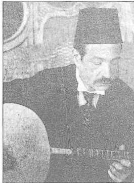
Tanbûrî Cemil Bey

Eline aldığı herhangi bir sazı kısa bir müddet sonra çalabilmesiyle tanınan ve