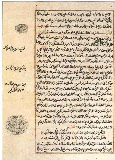
Cenâbî tarihinin Arapça muhtasarı olan Nihâyetü'l- merâm 'ın ilk iki sayfası (Köprülü Ktp., nr. 1031)

Metot bakımından klasik Arap tarihçiliği geleneğine uygun şekilde yazılan eserde başvurulan kaynakların tenkidine yer verilmesi ve nerelerde hangi kaynakların kullanıldığı belirtilmesi, Cenâbî'nin tarih anlayışını göstermesi bakımından önemlidir. 1587'de tamamlanan eser Sultan III. Murad'a ithaf ve takdim edilmiştir. 997 (1588-89) yılına kadar gelen Osmanlı tarihi bölümü de-