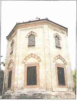
Cenâbî Ahmed Paşa Türbesi

bugün yenilenmiş olan bir madalyon süslemesi yer alır. Mermer mukarnaslı mihrap sade bir işçilik gösterir; yine mermerden olan minber ile geometrik geçmeli mermer korkuluk levhalarıyla dikkat çeken iki katlı müezzin mahfili de bu sade üslubu sürdürür. Minberde 1305 (1887) tarihini veren sülüs bir kitâbe mevcuttur. İç mekânda süslemede aşırılıktan özenle kaçınılarak sadeliğe yönelindiği dikkat çeker. En önemli süsleme unsuru, kubbenin içi ile birlikte pencerelerin üzerinde görülen kalem işi bezemelidir.