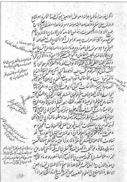
Cevâhirü'l-kelâm adlı eserin ilk iki sayfası (Süleymaniye Ktp., Lâleli, nr. 2171)