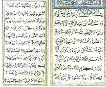
Cezülî'nin Delâ' ilü'l-hayrât adlı eserinin ilk iki sayfası (İÜ Ktp., AY, nr. 487)

Fas'ın güneyinde bulunan Sûs vadisi-nin Cezûle (Cüzûle) bölgesindeki Simlâl köyünde doğdu. O dönemde Güney Fas ve bölgenin ilim merkezi olan Merakeş Portekiz tehdidi altında bulunduğundan Fas şehrine giderek memleketinde başladığı tahsilini orada sürdürdü. As-