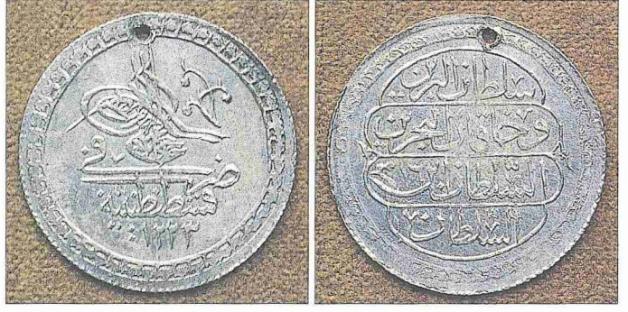
1223 (1808) tarihli cihâdiyye kuruşu (İstanbul Arkeoloji Müzesi, Teşhir, nr. 1966)