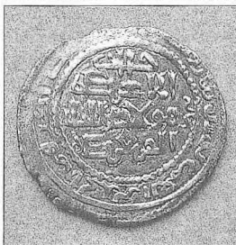
663 (1264-65) yılında Cizre'de Hülagû Han adına basılan gümüş sikke (İstanbul Arkeoloji Müzesi, Teşhir, nr. 2203)