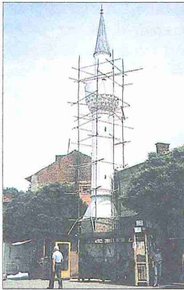
Cum‘a-i Bâlâ’da ayakta kalan tek caminin (XIX. yüzyıla ait) onarımı sırasında görünüüşü (1992)

Kâtib Çelebi ve Evliya Çelebi’nin eserlerinde zikredilmeyen Cum‘a-i Bâlâ’yı XVIII. yüzyıl sonunda gören Felix Beajour, burayı Djoumaia adıyla anarak Osmanlı ordusunda ileri karakol hizmetinde bulunan yörüklerle iskân edilmiş bir kasabacık (bourg) olarak belirtir. 1847’de yöreye gelen Viquesnel ise burada 730 evin bulunduğunu, bunların 250’sinin hıristiyan Bulgar, geri kalanının da Türkler’e ait olduğunu yazar.