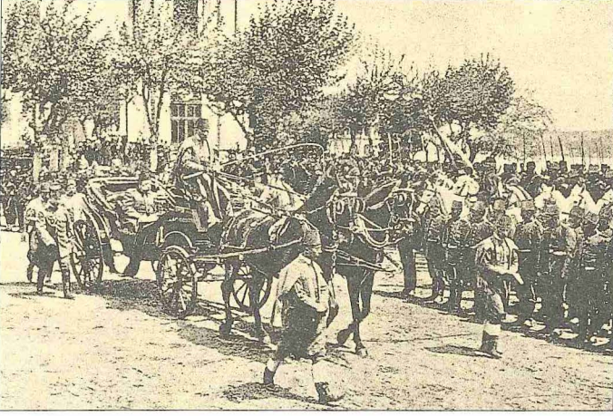
Sultan Resad'ın Dolmabahçe'de bir cuma selâmlığı