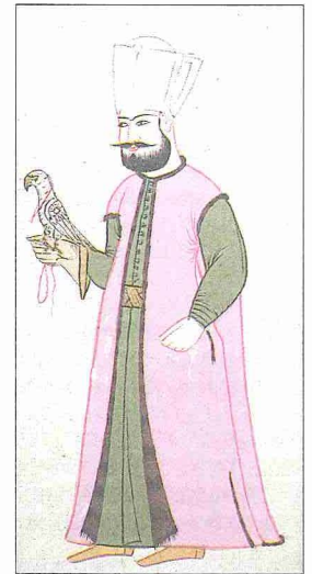
Çakırcıbaşı (Gastellan Histori Tahtureks)

Taşradaki çakırcılar dağlarda çakır yuvalarına çıkıp çakır yavrularını toplar, bunları av için yetiştirirlerdi. Bu hizmetlerini karşılık vergiden muaf tutulurlar ve timar* tasarruf ederlerdi. Padişahların