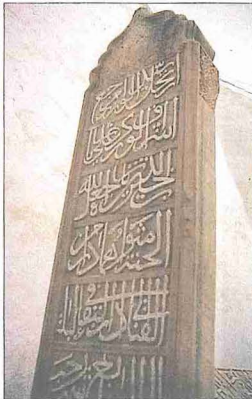
Çandarlı Kara Halil Hayreddin Paşa'nın Çandarlı Türbesi içindeki sandukası ile mezar taşı - İznik / Bursa