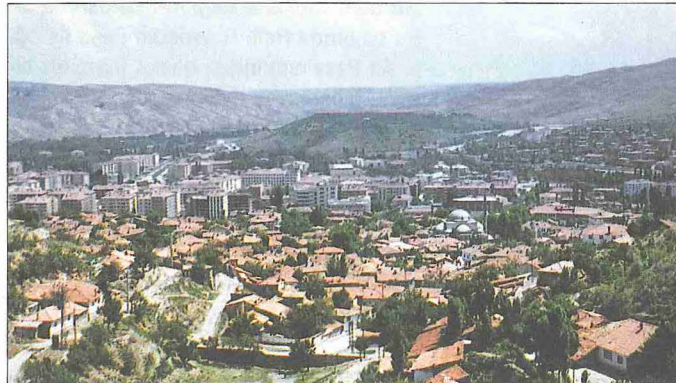
Çankırı'dan bir görünüşü

Duvarlar bir sıra küfeki taşı ve bir-üç sıra tuğla ile örülmüştür. Kubbe kasnaklarının ve batı mekânı cephelerinin üstünde tuğladan kirpi saçak dolanmaktadır. Her iki kısmın da kubbesi ve doğudakinin köşe pahları kiremit kaplıdır.