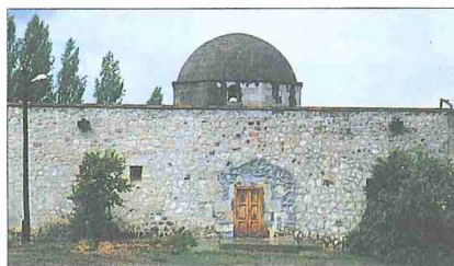
Taşmescid (Şifâhâne) - Çankırı

Çankırı'nın ekonomisi Osmanlılar devrinde daha çok ziraata ve küçük el sanatlarına dayanıyordu. Özellikle keçe ve yünlü imalâtı şehir ekonomisinde önemli bir yere sahipti. 1521'de şehirde, yirmi altısı mülk ve altmış altısı vakıf olmak üzere en az doksan iki dükkân bulunuyordu (BA, TD, nr. 438, s. 704-715). Bundan başka bir mum imalâthânesi ve bir bozahâne ile çeşitli vakıflara ait birer bedesten, kervansaray ve bezirhâne mevcuttu. Ayrıca şehirde her türlü malın alınıp satıldığı bir pazar yeri vardı. Buradaki pek çok dükkân ve ticarî tesisin vakıflara ait olması, şehrin ticarî ve ekonomik gelişmesinde vakıfların önemli bir rol oynadığını göstermektedir. Şehir esnafı arasında Ahilik prensiplerine olan bağlılığın bugün dahi devam etmesi, esnaf arasındaki ilişkilerin dayandığı temele bir işaret olmalıdır.