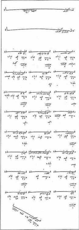
XVI. yüzyılın ilk yarısında Çankırı'nın mahallelerini gösteren bir belge (BA, TD, nr. 438, s. 703)

şikâyetlerini İstanbul'a kadar bildirdi. Çankırı'da bundan sonra da bazı olaylar cereyan etti, fakat bunlar Celâli isyanları kadar büyük tesir uyandırmadı. XVIII. yüzyılın ortalarından itibaren şehir yavaş yavaş Çapanoğulları'nın nüfuz sahası içinde kalmaya başladı.