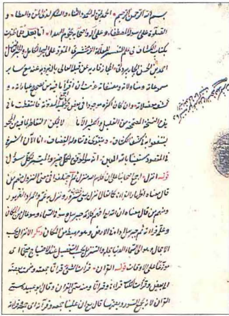
Çârperdi'nin Hâşiye 'ale'l-Keşşâf adlı eserinin ilk ve son sayfaları (Süleymaniye Ktp., Lâleli, nr. 328)