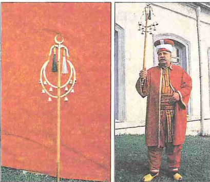
Çevgân ve çevgânibaşı

Cehâz (cihâz) Arapça'da "yolcunun, gelinin ve sefere çıkacak ordunun ihtiyaç duyacağı eşya, gıda maddesi, silâh vb. malzemeler" anlamına gelir. Türkçe'ye cihâz şekliyle geçen kelime ayrıca çehiz ve çeyiz olarak yaygınlık kazanmış ve gelinin baba evinden götürdüğü elbise ve benzeri eşya için kullanılmıştır.