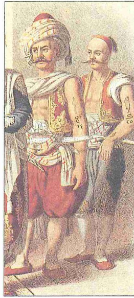
Çıplak ve çıplak cavuşu (Ârif Mehmed Paşa, Mecmûa-i Tevâir-i Osmanîyye , İstanbul 1279, levha V)

III. Selim devri kaptanpaşalarından Küçük Hüseyin Paşa'nın kaptan-ı deryâliği zamanında 1792'de onun tarafından teşkil edildiğinden bazan "Hüseyin Paşa çıplağı" diye de anılırdı. Çıplaklar kaptanpaşanın refakatinde âdeta bir merasim