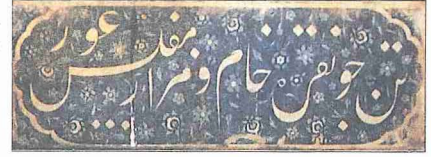
Çinili Hamam'ın sıcaklık bölümündeki yazılı çini panolarından biri

Yapıya ismini veren çini süslemeler, bugün sadece erkekler kısmının sıcaklık bölümünde kalmış bulunmaktadır. Halvet kapılarının her iki yanındaki nişlerin üzerinde toplam sekiz adet dikdörtgen levha ve her kapının üzerinde de altıgen, üçgen ve ince şerit şeklindeki levhaların birleşmesinden meydana gelen büyük birer altıgen çini pano dikkat çeker. Aynı biçimde bir pano da girişin karşısındaki eyvanda duvarın ortasına yerleştirilmiştir. Çinilerin hepsi şeffaf-renksiz sır altına beyaz hamurlu olup mavi ve firuze boylarla yapılmış, koyu maviiyle tahrirlenmiş süslemelere sahiptir. Bunların tamamı XVI. yüzyılın ilk yarısına ait mavi-beyaz İznik çinilerinin firuze eklenmesiyle zenginleştirilmiş en zarif örnekleridir. Kapıların yanlarındaki dikdörtgen levhaların bitkisel zemin süslemelerinin üzerinde, beyaz renkte çok itinalı bir ta'lik yazı ile yazılmış Farsça hammâmiyye mısraları yer almaktadır.