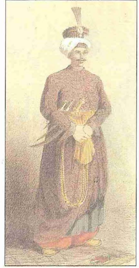
Başçuhadar ağa (Ârif Mehmed Paşa, Mecmûa-i Tesâvür-i Osmâniyye , İstanbul 1279, levha II)

Başçuhadarın teşrifat görevleri de vardı. Meselâ vezîriâzam, şeyhülislâm, Kırım hanı ve rikâb-ı hümayun kaymakamlığına tayin edilenleri sarayın Soğukçeşme Kapısı'nın iç tarafında karşılar, yandaki peyk ve solaklarla birlikte bun-