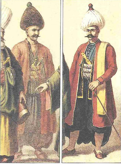
Salma başçuhadarı ile Kuloğlu başçuhadarı (Ârif Mehmed Paşa, Mecmûa-i Tesâvir-i Osmaniyye , İstanbul 1279, levha XV)

halefi olan çuhadara devredilir ve hazırlanan defterin biri padişaha, diğeri de yeni çuhadara teslim edilirdi. XVIII. yüzyılda ilk tayini sırasında çuhadara 11.300 çürük akçe verilirdi.