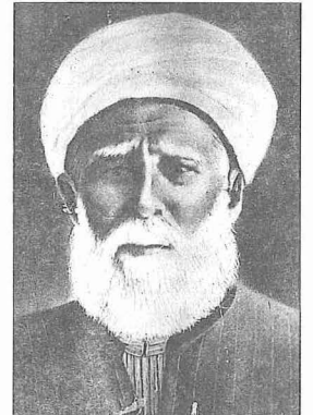
Ömer Ziyâeddin Dağıstani