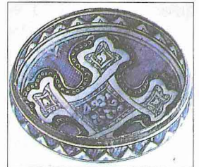
XV ve XVII. yüzyıllara ait Dağıstan seramik sanatı örnekleri (Elsevier Séquoia, L'art de Byzance et de l'Islam. Bruxelles 1979, s. 454, 481)

Dil ve Edebiyat. Pek çok kavmin birbirine karıştığı ve birlikte yaşadığı bir ülke olan Dağıstan'ın dil ve edebiyatı çeşitlilik gösterir. 1640'ta Dağıstan'ı ziyaret eden Evliya Çelebi, bugün Dağıstan'daki mahallî dilleri konuşan Kaytaklar'ın o zaman Moğolca konuştuklarını ve bunların Mahan'dan gelme Moğol Türkleri olduklarını söyler ( Seyahatnâme , II, 292). Dağıstan'da Hunzak, Hundaşı, Balkar, Kazar-Begüm, Okuzkent, Bayat, Etrek,