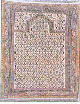
XIX. yüzyıla ait Dağıstan sajdahi (Oriental Carpets and Textiles 1987, s. 40)

di. 815 yılında Şeyh Ebü İshak ile Şeyh Muhammed el-Kindî yaklaşık 2000 kişiden oluşan bir gönüllü ordusuyla Dağıstan'a girerek İslâmiyet'i yaymaya çalıştılar. Dağıstan Abbâsiler zamanında Azerbaycan ve Ermîniye valileri tarafından idare edildi. Abbâsiler'in zayıfladığı bir dönemde 869'da Hâşimî hânedarı Derbend'i merkez yaparak burada hüküm sürmeye başladı. X. yüzyılda Sâcoğulları Derbend'e hâkim olduysa da Hâşimîler kısa bir süre sonra şehri tekrar ele geçirdiler. XI. yüzyılın ikinci yarısında Selçuklu Türkleri bölgenin bir kısmını hâkimiyetleri altına aldılar. Dağıstan 1222'de Moğol istilâsına uğradı. XI-XIII. yüzyıllarda Karadeniz'in kuzeyinde ve Kafkaslar'da hüküm süren Kumanlar (Kıpçaklar) Dağıstan'a kadar sokularak bölgenin Türkleşmesinde önemli rol oynadılar. Daha sonra sırasıyla İlhanlılar, Altın Orda Hanlığı, Timurîlular, Şirvanşahlar ve Safevîler Dağıstan'a hâkim oldular. Dağıstan 1578-1606 yılları arasında Osmanlı hâkimiyeti altında kaldı.