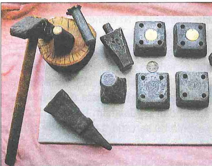
Çeşitli darp aletleri (İstanbul Arkeoloji Müzesi, kalıplar teşhir vitrini)

1879'dan itibaren değeri düşen gümüşten külçe alımı suretiyle yeni gümüş para basılmamaya başlandı. Bunun sebebi, gümüş paranın miktarını artırıp değerini daha fazla düşürmemektir. Gümüş para, ancak tedavülden çekilen sikkelerin eski gümüş paralardan darbediliyordu. Abdülmecid zamanından beri darphânedeki altından 500, 250, 100, 50, 25 ve 12,5 kuruş değerinde altın paralar ve gümüşten 20 kuruşluk mecdiye, 10, 5, 2 ve tek kuruşlar basılıyordu. 20, 10 ve 5 paralar ise gümüşten darbedilmemekteydi. Osmanlılar'da 500 kuruşluk meblağa "kise" dendiğinden 500 kuruşluk altın da bu adla anılmaktaydı. Fakat asıl temel birim 100 kuruşluk altın olup buna "lira" deniliyordu. Diğer sikkeler ise bunun katları veya küsurlarıydı.