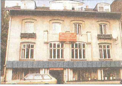
Kocatepe Camii - Kopenhag / Danimarka

toplannmıştır. Bu arada Pakistanlılar'ın daha çok kurs ve mescidler, Araplar'ın da İslâm kültür merkezleri açtıkları görülmektedir. Etnik bakımdan en kalabalık grubu oluşturan Türkler arasında, 1984 yılında Türkiye Büyükelçiliği bünyesinde yer alan din hizmetleri müşavirliğinin çalışmaya başlamasına kadar bir düzensizlik vardı. Bu tarihten sonra teşkilatlanma yarışına giren Türkler'in en önemli kuruluşu Danimarka Türk Diyanet Vakfı olmuştur. Ülkedeki müslüman Türkler'e hizmet vermek amacıyla kurulan vakıf, din hizmetleri müşavirliği ile iş birliği yaparak Kopenhag ve diğer şehirlerde toplam otuz altı adet Türk kültür merkeziyle birçok cami, Kur'an kursu, kütüphane ve lokal açmış, bu merkezlere Türkiye'den din görevlilerinin tayin edilmesiyle dinî hizmetlerde bir iyileşme sağlanmıştır. Ayrıca Danimarka Türk Diyanet Vakfı'na bağlı olarak faaliyet gösteren cenaze nakli yardımlaşma fonu, Türkler'in bu alandaki ihtiyaçlarını cevap vermektedir.