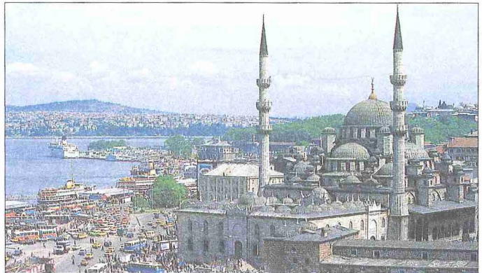
Yenicami - Eminönü / İstanbul

Dâvud Ağa, Osmanlı devri Türk mimarisinin Koca Sinan ile başlayıp gelişen klasik dönemini onun gelenekleriyle sürdüren bir mimardır. Hakkında birçok belge elde edilmiş olmakla beraber hayatının büyük bir kısmı bilinmediği gibi hangi tarihte nasıl öldüğü de tam olarak tesbit edilebilmiş değildir. Eserleri, onun Türk klasik üslubunu bazı yeniliklerle sürdüren bir usta mimar olduğunu gösterir.