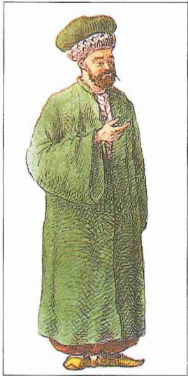
Defter emini (M. Şevket Paşa, Osmanlı Teşkilât ve Kıyâfet-i Askeriyesi, İÜ Ktp., TY, nr. 9391)

Defter eminiğine tayinler umumiyetle Dîvân-ı Hümâyun kalemleriyle Defterhâne'den yetişen kâtiplerden, dergâh-ı âlî müteferrikalarından, yeniçeri kâtiplerinden, defterdarlardan, nişancılarından ve reisülküttâblardan yapılırdı. Defter eminiği "münâvebe" mansıblarından olduğu için nişancı, reisülküttâb ve defterdarlardan mâzül kalanlar buraya tayin edilir ve daha sonra tekrar eski vazifelerine nakledilirlerdi. Bilhassa mevki itibarıyla defter eminiğiyle aralarında fazla fark bulunmayan reisülküttâblıktan defter eminiğine, defter emini-