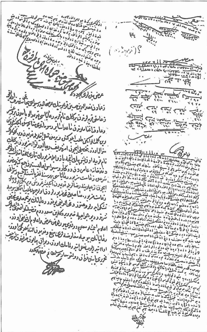
Defterhâne tarafından Kanunnâmesi'nin bir kısmının derkenâr olarak çıkarıldığı bir arz (BA, A.DVN, Dosya, nr. 360, Evr. 14)