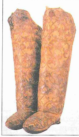
Deri çizme (TSM. Envanter, nr. 2/4447)

Tanzimat'tan sonra Osmanlı deri sanayiinde büyük bir gerileme oldu. Başlangıçta mezbahalarda kesilen hayvanların postlarını olduğu gibi alan debbâğ esnafı bunların yün ve kıllarını keçeci, külâhçı ve yorgancılara satarak gelir sağlardı. Debbâğların tekeli ve gedik * sisteminin kaldırılmasından sonra bu imkândan mahrum kalmaları, yabancı tüccarların ham derileri yüksek fiyatla toplayıp dışarıya götüremeleri sebebiyle işleyecek deri bulamamaları, bulduklarını ise artan fiyatları yüzünden satın alamamaları gittikçe fakirleşmelerine ve bu sanatın gerilemesine yol açtı. Öte yandan Avrupa'da her zanaat dalında olduğu gibi debbâğlığın da makineleşmesi ve Osmanlılar'ın bu gelişmeye ayak uyduramaması gerilemeyi hızlandırdı. Avrupa ile rekabete dayanamayan debbâğları bir araya getirmek ve deri sanayiini geliştirmek için 1864 yılında bir islah komisyonu kuruldu. Bu komisyon gedik imtiyazının yine eskisi gibi devam etmesine ve debbâğ esnafının ayrı ayrı çalışmayıp birleşerek bir ortaklık kurmasına karar verdi. Eylül 1866'da 11 altın sermaye ile kurulan ve otuz maddelik bir nizamname ile işe başlayan Şirket-i Debbâğıyye Avrupa standartlarına uygun