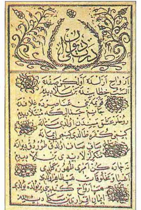
Dertli'nin matbu divanının ilk sayfası (İstanbul 1299)